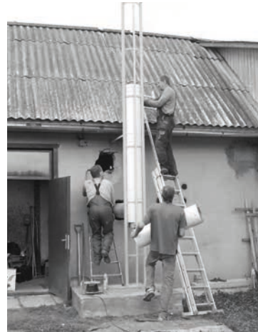
Notiek jaunā apkures katla ierīkošana

cākiem iestādē sāksies 2. septembrī pulksten 14.30. Gaidām visus savus bērnus kopā ar viņu vecākiem!