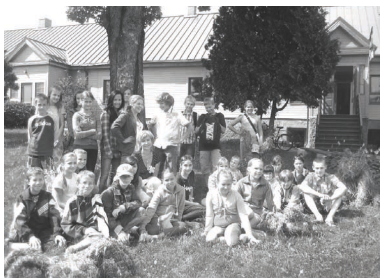
Nometnes „Raibā nedēļa” dalībnieki

Augusta pirmajā nedēļā jau otro gadu skolā notika vasaras nometne „Raibā nedēļa”. Tajā radoši un interesanti brīvo laiku pavadīja un sevi garīgi un fiziski pilnveidoja 25 bērni no Bejas, Malienas, Kolberģa un Alūksnes. Nometnes dalībnieki piedalījās salmu skulptūru veidošanas, veselīga dzīvesveida, friziermākslas, rotaslietu darināšanas, dāvanu veidošanas, pavārmākslas, papīra plastikas darbnīcās. Viena no dienām bija veltīta fiziskajām aktivitātēm atpūtas kompleksā „Jaunsētas”. Novadpētniecībai un tūrismam veltītajā dienā vēroja video filmu par dabu, veidoja prezentāciju ceļojuma maršrutam pa Alūksnes novadu, piedalījās komandu praktiskajās sacensībās. Nometnes noslēgumā, uz kuru bija aicināti arī vecāki, notika bērnu darbu izstāde, vaļasprieku prezentācija, mielošanās ar kliņģeri