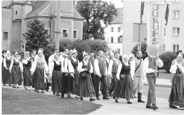
„Jukums” piedalās festivāla gājienā

Vedām uz Nisu 3 horeogrāfiskus uzvedumus „Pierobežā dzīvodami jeb Danču vokars Malīnā”, „Mūsu ziema” un „Tāds mūžiņš līnīgam”. Apes vokālajam ansamblim koncertsomā līdzī bija paņemtas 3 dažādas latviešu dziesmu izlases, kuras dziedātājas pavadīja un papildināja ar ritma instrumentiem, vijoli un akordeonu. „Jukumam” gan viena no sākotnējām bažām bija, kā ietilpināt visu programmu tautas tērpus un rekvizītus autobusā, jo jā-