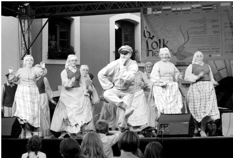
Festivāla skatītājiem „Jukums” rādīja trīs deju uzvedumus

Festivāla dalībnieku vārdā, Inita Veismane