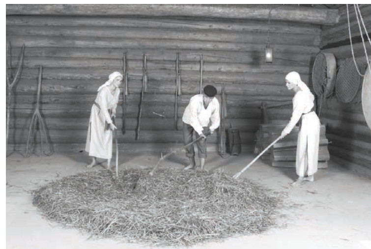
Arī Pļaujas svētkos Atē varēs vērot un piedalīties dažādos lauku darbos

Liels prieks ir par visiem, kas nolēmuši atbalstīt Pļaujas svētkus Atē - folkloras kopām no Alūksnes, Gulbenes, Balvu un Valmieras