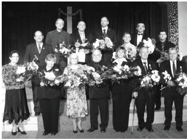
Sudraba zīli pērn valsts svētkos pasniedza pirmo reizi

Ierosinājumu par kādas personas apbalvošanu aicinām rakstīt brīvā formā. Lūdzam ierosinājumā norādīt apbalvošanai pieteiktās personas vārdu, uzvārdu, darba vietu un ieņemamo amatu (ja tādi ir), kā arī motivētu pamatojumu, kādēļ jūsuprāt šī persona būtu jāapbalvo. Tāpat lūdzam norādīt informāciju arī par pieteikuma iesniedzēju - vārdu un uzvārdu vai organizācijas