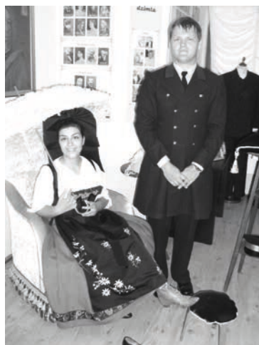
Izrādās, arī franču dāmām der baroneses zābaciņš

vairākas stundas. Viņiem ļoti patika meklēt dārgumus caur gada skait- ļiem. Īpašu vērtību izpelnījās bērnu pavasara darbs „Cāļu sargāšana”. Īpaši viesus aizrāva šaušana ar „ka- ķenēm” un pat izskanēja jautājums, vai tas esot nacionālais sporta veids.